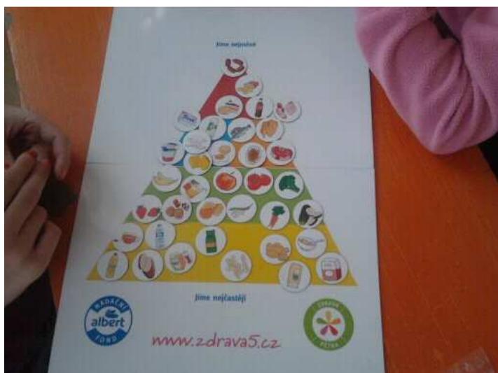
Zdravá Pětka – zábavně-výukový program