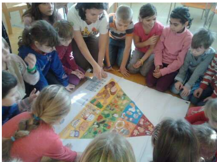
Zdravá Pětka – zábavně-výukový program