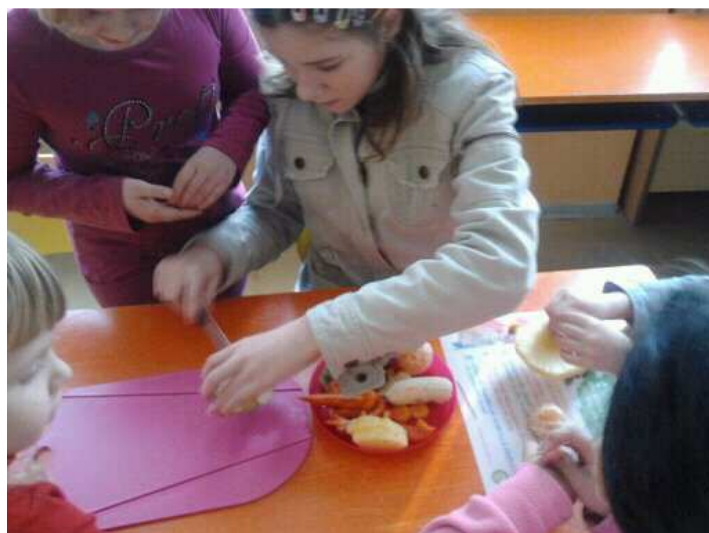
Zdravá Pětka – zábavně-výukový program